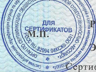
Схема сертификации ЗС

Сроки хранения (годности) указаны в прилагаемой к продукции товаросопроводительной документации и/или на упаковке каждой единицы продукции.